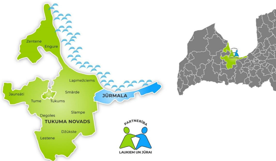
1.att. Partnerības teritorija kartē

Partnerības darbības teritoriju veido piekrastes teritorijas - Tukuma novada Engures un Lapmežciema pagasti un Jūrmalas valsts pilsēta un iekšzemes teritorijas - Tukuma novada Smārdes, Zentenes, Slampes, Tumes, Degoles, Jaunsātu, Džūkstes un Lestenes pagasti un Tukuma pilsēta.